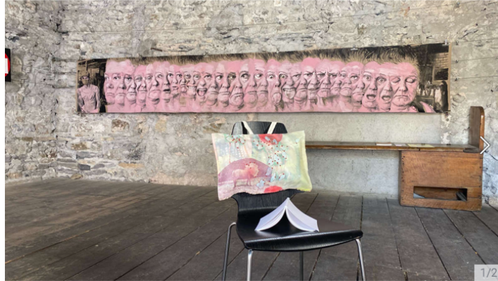
Installation der Künstlerin Heike Röhle.