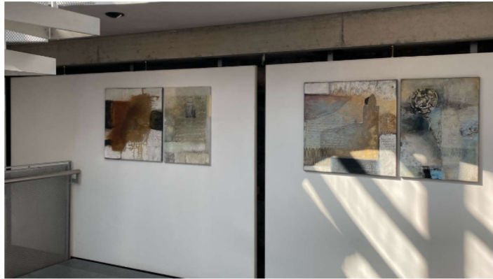
Bilder von Brigitte Keist. Quelle: Soblue Weina