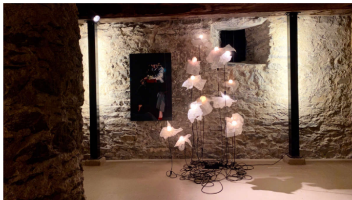
Installation von Valeria Triulzi.