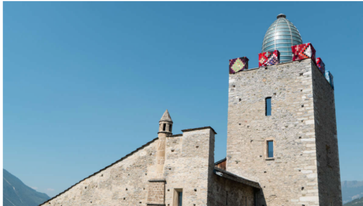
Schlosssturm, eingekleidet mit Omas Glोजzjini.

Zu sehen sind Bilder, Installationen, Fotos, Skulpturen. Vielfältig ist das Schaffen der verschiedenen Künstlerinnen. Gesellschaftskritisches, Sozialpolitisches wurde von den Künstlerinnen umgesetzt. Andere nehmen mit ihren Werken Bezug zur Landschaft oder zum Schloss.